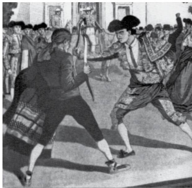
Duel en el 3r acte de Carmen. 1913. Le Petit Journal (Paris)

Quan era un jove actor, la casualitat em va fer participar en una estrena teatral de diferents obres