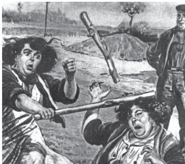
Figura 2 Duel de camperoles

A les diferents escoles d'art dramàtic del món el combat escènic s'ensenyava segons les necessitats d'un programa específic, seguint diferents pautes i durant quantitats de temps variades. Com un dels exemples,